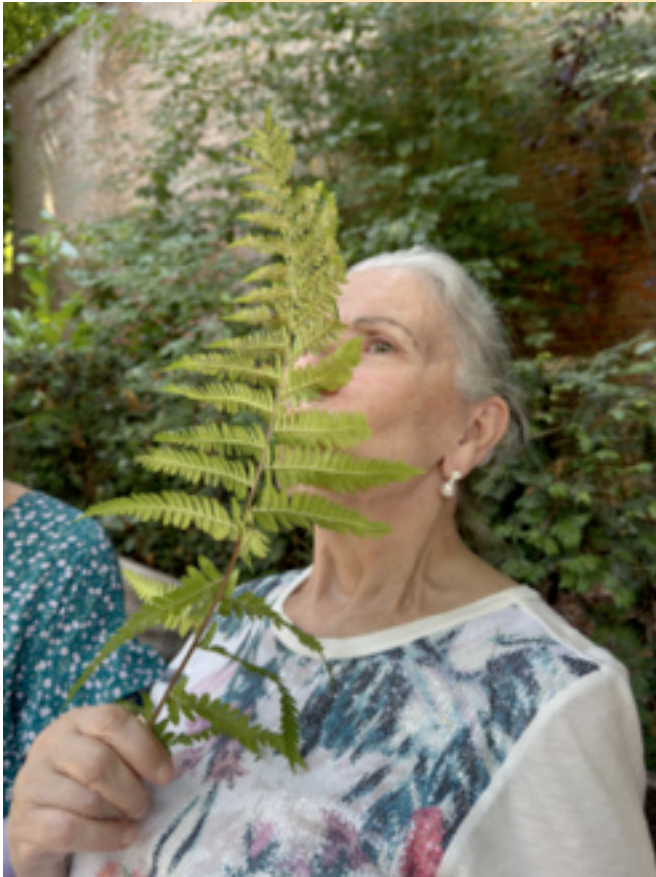
Genieten van een zintuigen-wandeling