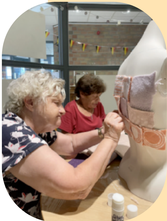
Plezier in het crea lokaal