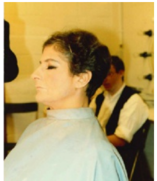
Uit het toneelstuk 'De Beer' van 'Tsjechov'